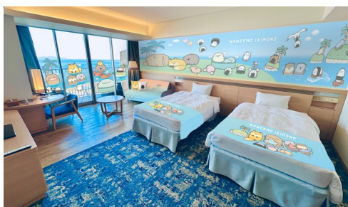
コラボルーム イメージ