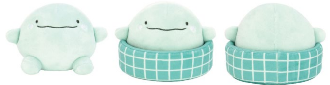
ぬいぐるみ S おふる イメージ