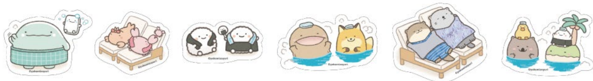
ステッカー イメージ