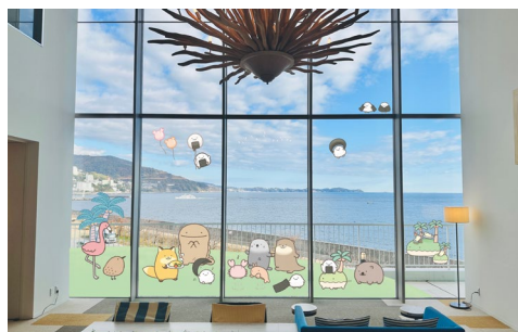
オーシャンスパ Fuua 装飾 イメージ

オーシャンスパ Fuua 館内を、「なんでもいきもの」の可愛いいきものたちの装飾で彩ります。 絶景のオーシャンビューを楽しみながら、「なんでもいきもの」のいきものたちとのんびりお過ごしいただけます。 詳細は、決まり次第お知らせします。