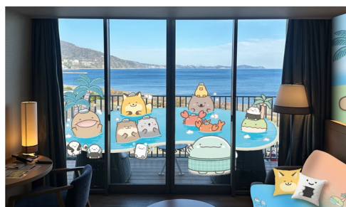
コラボルーム イメージ