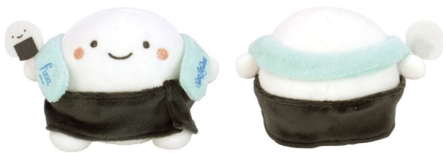
ぬいぐるみ S ゆあがりおにぎり イメージ