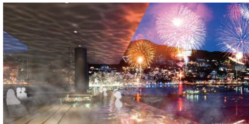
<露天立ち湯 イメージ>