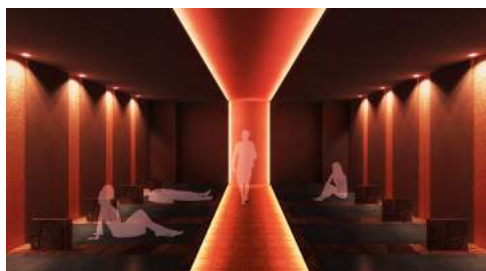
<岩盤浴Laava (ラーヴァ) イメージ>