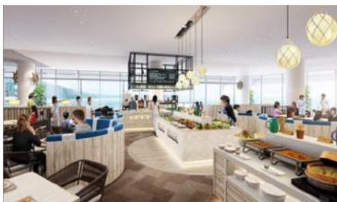
<ブッフェエリア イメージ（昼）>