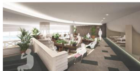
<アタミリビング内 クリフラウンジ イメージ>