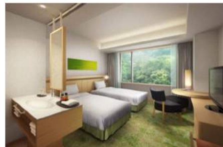
<コートヤードツイン イメージ>