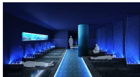
<岩盤浴Meressä (メレッサ) イメージ>