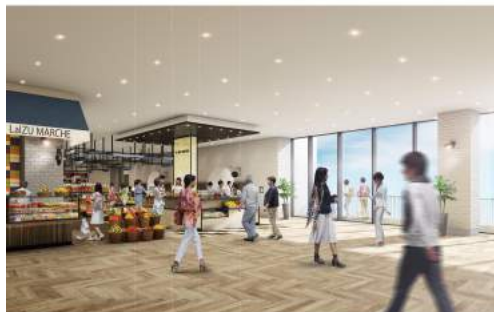
<ラ・伊豆 マルシェ イメージ>