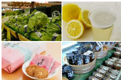
<取り扱い商品イメージ>