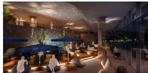
<アタミリビング内 オーシャンラウンジ イメージ (夜) >